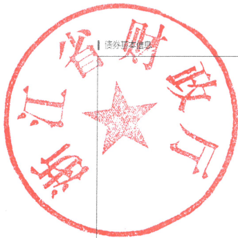
地方政府新增专项债券项目信息披露模板